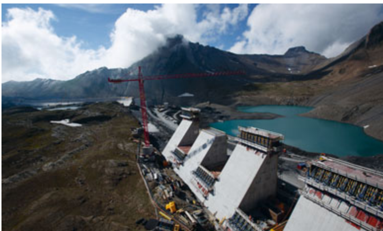
Staumauer Muttssee, Glarner Alpen

Was in der Schweiz fehlt, sind nicht Pumpspeicherwerke, sondern im grossen Stil die technischen Einrichtungen in der Netz-Architektur, die es erlauben würden, dezentral solar erzeugte Überschüsse in die Hochspannungsnetze zu bringen, so dass sich die Kapazitäten der Pumpspeicherwerke überhaupt erst für die Aufnahme solar erzeugter Überschüsse erschliessen. ●