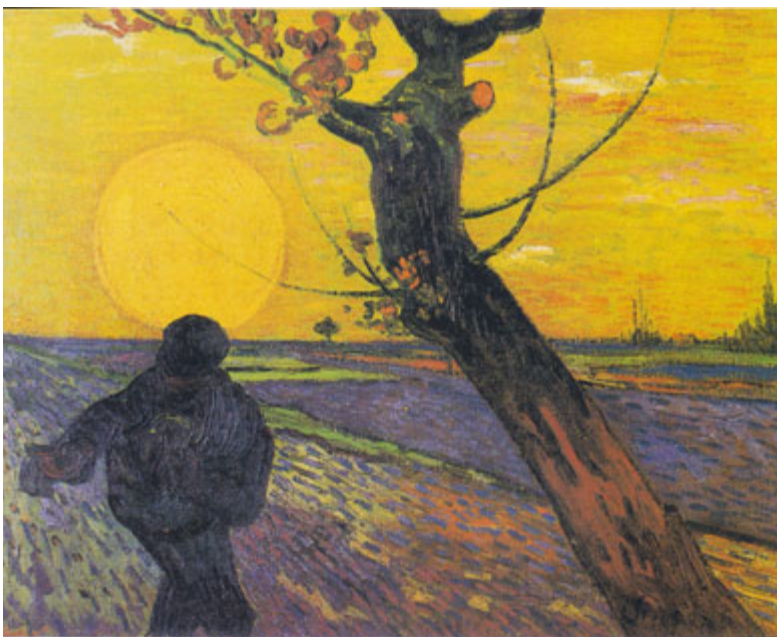
«Sämann bei untergehender Sonne», Vincent Willem van Gogh.

Spurgeon schliesst mit dem Hinweis, wie wichtig die Optik, «ein bestimmtes, festes Ziel» ist. Und richtet den Blick auf Jesus als den Gekreuzigten und Auferstandenen, zu dem wir aufschauen dürfen.